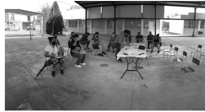
Imagen 1: Mapa comunitario colectivo

de no normalizar o naturalizar los problemas debido a que ocurren con frecuencia, sino que se deben visualizar y buscar una solución. A continuación se muestra el mapa comunitario, que ahora se le puede llamar “mapa comunitario colectivo de recursos y de problemas”.