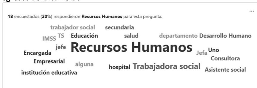
Figura 2. Lluvia de ideas ¿Qué puesto de trabajo te gustaría tener cuando egreses de la carrera?

ciales. Así mismo es de suma transcendencia destacar que en conjunto con dicha pregunta se les pidió a los estudiantes mencionar ¿Qué puesto de trabajo te gustaría tener cuando egreses de la carrera? siendo el de Recursos Humanos el que tiene mayor demanda.