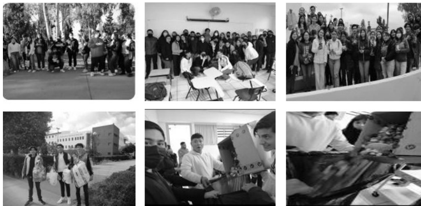
(grupos de Facultad de Contabilidad y Administración UABC, Tijuana).